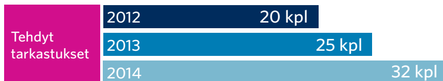
Kuvio 2: Tarkastusviraston tekemien tarkastusten määrä vuosina 2012–2014

Puoluerahoitusta koskevien tarkastusten kohteina oli yhdeksän eduskuntapuoluetta ja niiden 23 piirijärjestöä. Kaikkiaan tarkastuksia tehtiin 32, kun niitä edellisenä vuonna tehtiin 25 ja vuonna 2012 kaikkiaan 20. Tarkastuksista ilmoitettiin tarkastettaville toukokuussa 2014, tarkastettavat toimittivat pyydetyn ennakkomateriaalin tarkastusvirastolle pääosin ennen tarkastuksia, ja tarkastukset toteutettiin tarkastussuunnitelman mukaisesti syyslokakuussa 2014. Vaalipiirimuutosten vuoksi tietopyyntöjä ja tarkastusta kohdistettiin samassa yhteydessä myös valtionavustusta saaneisiin mutta sittemmin lakkautettuihin tai toimintansa lopettaneisiin piirijärjestöihin.