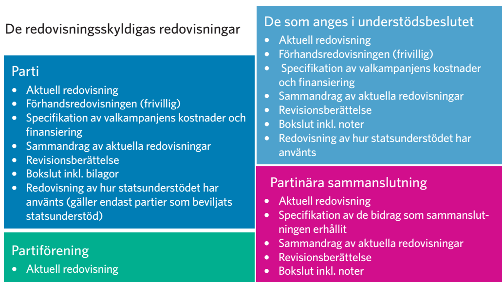
Figur 1: Redovisningsskyldiga och deras redovisningar enligt partilagen

I partilagen har föreskrivits om lämnande av olika uppgifter till statens revisionsverk. I det följande behandlas vilka uppgifter som ska lämnas till revisionsverket och vilken instans som är skyldig att lämna dessa uppgifter.