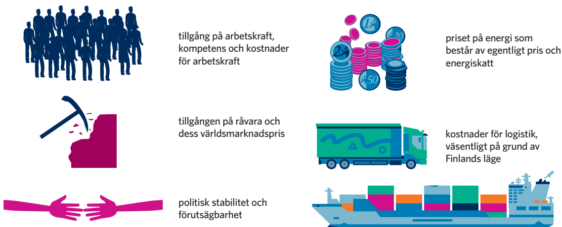
Figur 2: Förutsättningar för gruvföretagets investeringsprojekt

Investeringar bygger på projektspecifika kalkyler, inte på hur stort eller lönsamt ett företag totalt sett är