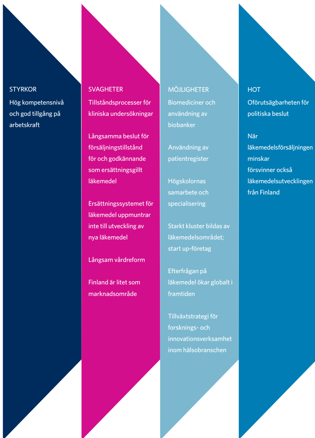
Figur 4: Läkemedelsindustrins styrkor, svagheter, möjligheter och hot