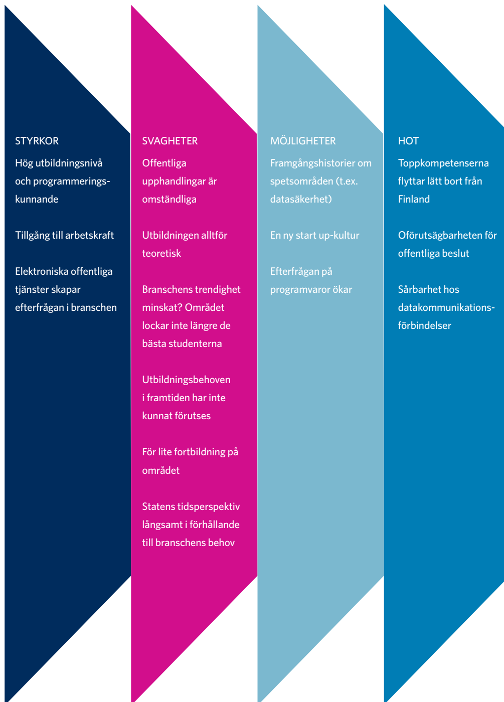
Figur 5: Programvaruindustrins styrkor, svagheter, möjligheter och hot