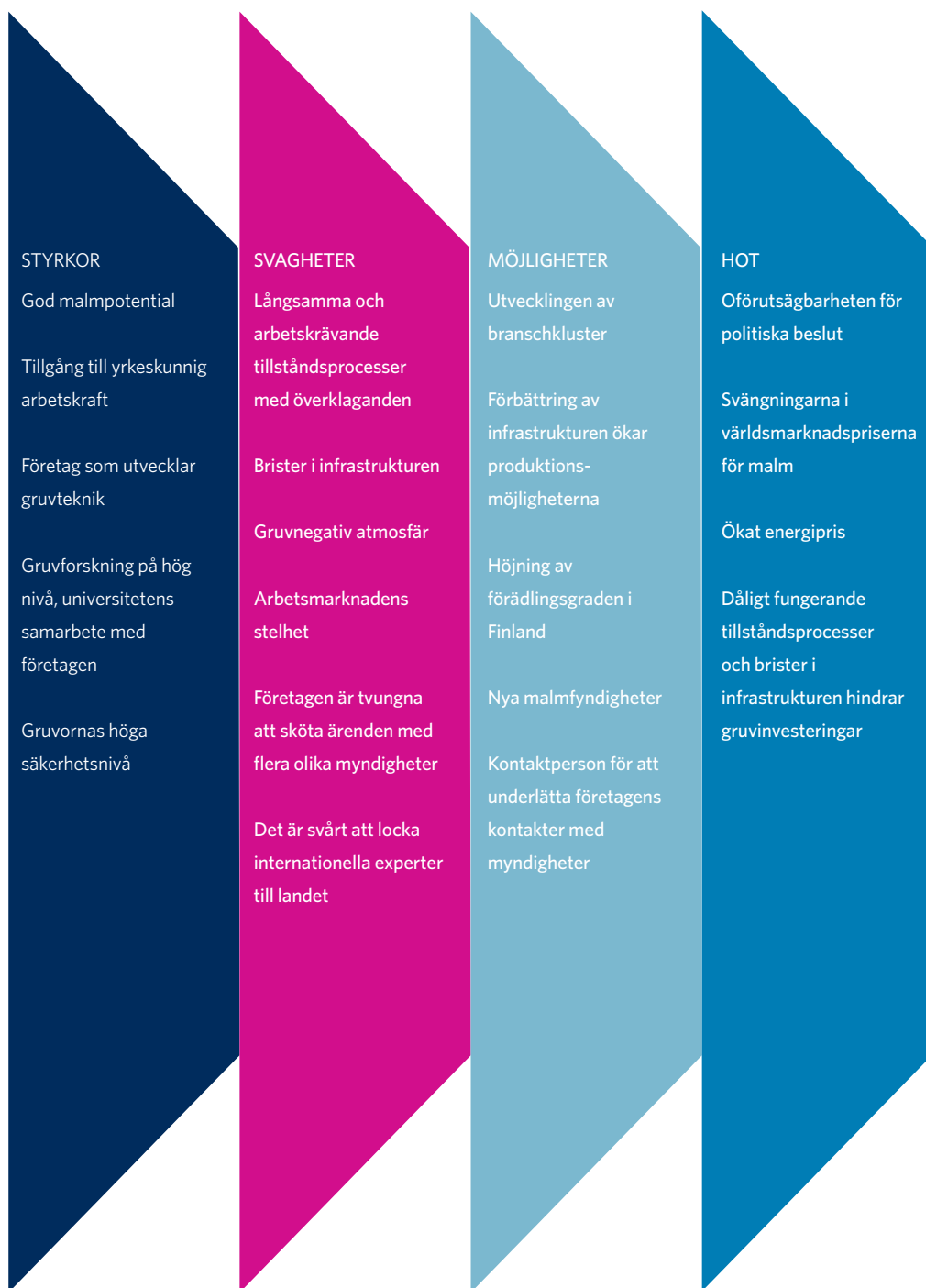
Figur 3: Gruvindustrins styrkor, svagheter, möjligheter och hot