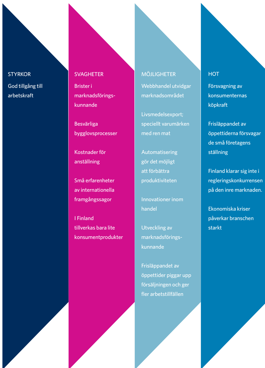
Figur 6: Detaljhandelns styrkor, svagheter, möjligheter och hot