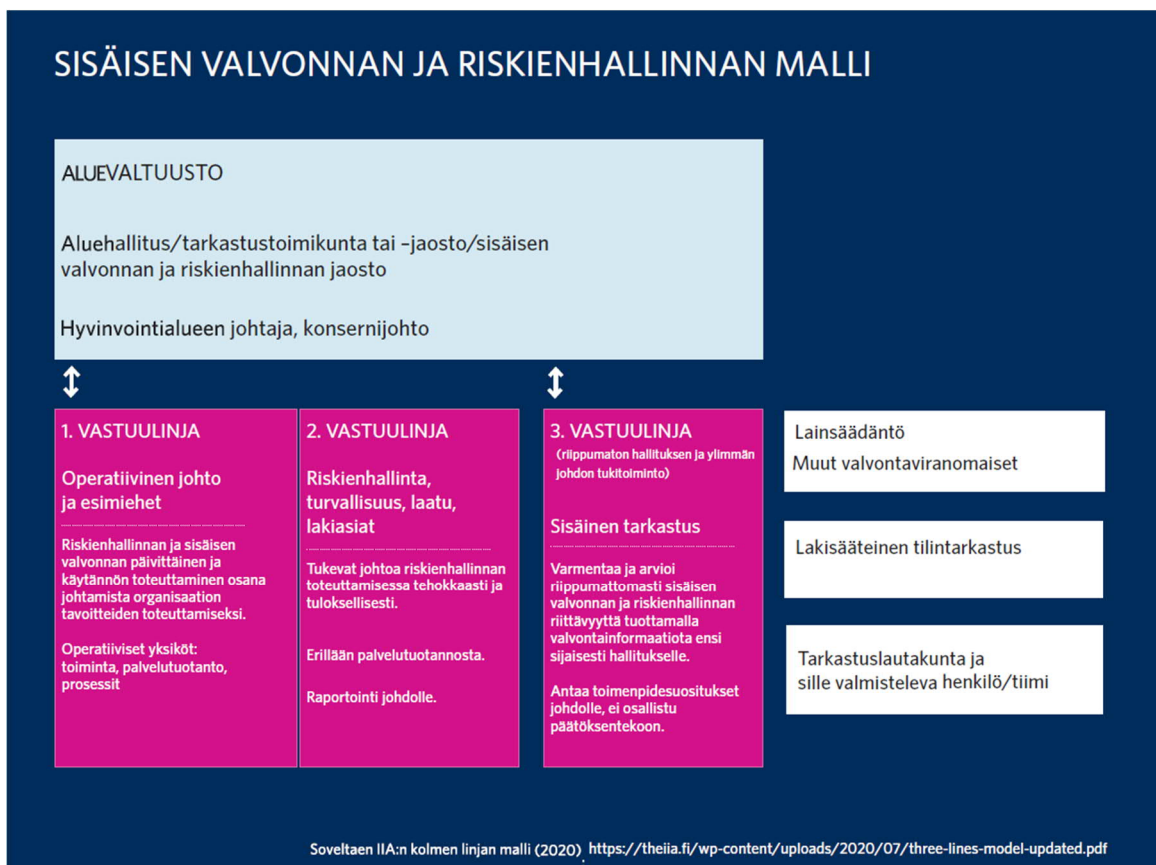
Kuvio 3: Sisäisen valvonnan ja riskienhallinnan malli soveltaen IIA:n kolmen linjan mallia (2020).

Seuraava niin sanotun Kolmen linjan mallin avulla voidaan kuvata sisäisen valvonnan ja riskienhallinnan eri vastuita ja rooleja. Hyvinvointialueen hallintomallissa se näyttäisi seuraavalta.