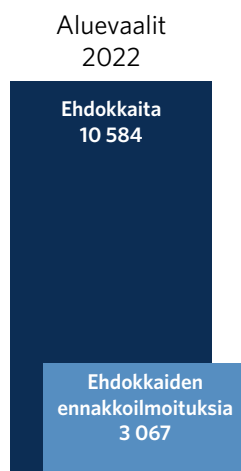
Kuvio 2: Ennakoilmoitukset vuoden 2022 aluevaaleissa.

Ennakoilmoituksen vaalikampanjojensa kuluista ja rahoituksesta toimitti määräaikaan mennessä yhteensä 3 067 henkilöä eli 29 prosenttia kaikista ehdokkaista. Kaikki määräaikaan mennessä toimitetut ennakoilmoitukset julkaistiin välittömästi julkaisujärjestelmässä.