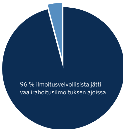
Kuvio 3: Määräajan noudattaminen aluevaaleissa 2022.

Vuoden 2022 aluevaaleissa ilmoituksensa jätti määräaikaan 28.3.2022 mennessä 2 681 ilmoitusvelvollista (96 %). Ilmoituksen jättämisen määräajassa laiminlöi siten 104 ilmoitusvelvollista. Osa ilmoitusvelvollisista jätti vaalirahoitusilmoituksensa määräajan jälkeen, mutta ennen ensimmäisen kehotuksen toimittamista.