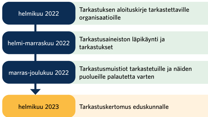
Kuvio 5: Puoluerahoitustarkastusten prosessi.