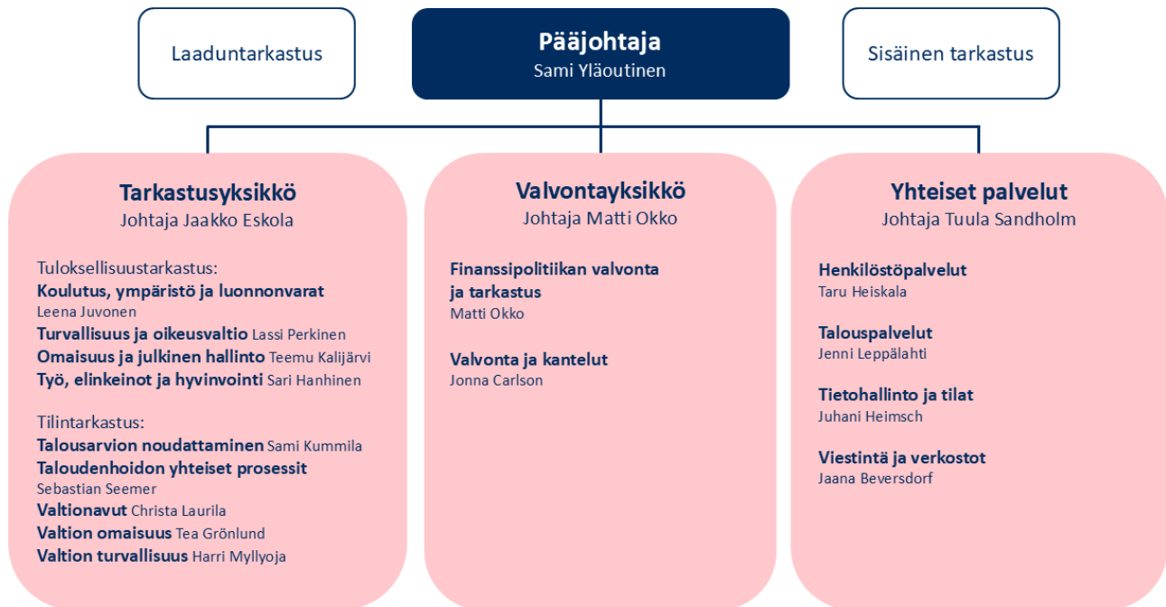
Kuvio 1: Valtiontalouden tarkastusviraston organisaatio.

Tarkastusvirasto toimii linjaorganisaationa, jota johtaa pääjohtaja. Tarkastusvirasto on organisoitu kolmeen yksikköön, jotka ovat tarkastus-, valvonta- ja yhteiset palvelut -yksiköt. Tarkastusyksikössä toteutetaan jatkuvaluonteiset tarkastukset sekä aihealueiltaan vaihtuvat tarkastukset, valvontayksikössä toteutetaan valvontatehtäviä, avoimuusrekisteritehtävä, kantelu- ja väärinkäytösilmoitusten käsittely sekä finanssipolitiikan tarkastuksia. Yhteiset palvelut -yksikössä toteutetaan koko virastolle yhteisiä palveluita ja prosesseja. Tarkastusyksikkö jakaantuu yhdeksään ryhmään, valvontayksikkö kahteen ja yhteiset palvelut neljään ryhmään.